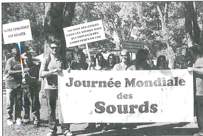
La marche dans le centre-ville de Joliette qui s'organise.