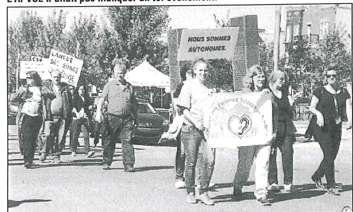
Ici, on voit 2 fières représentantes de la MFSM.

Association des Sourds de Lanaudière Inc.