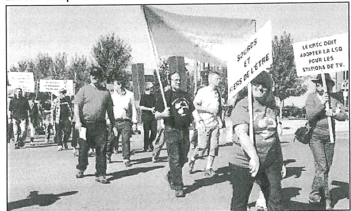
L'APVSL n'allait pas manquer un tel événement!