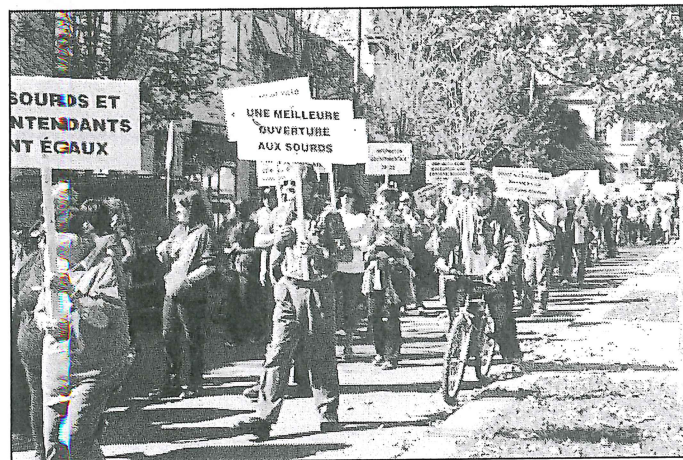
Cette journée aura permis de faire passer le message : la communauté sourde, la LSC et la défense des droits des sourds et malentendants, on y croit!